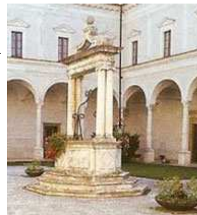
San Paolo D'Argon Chiostro