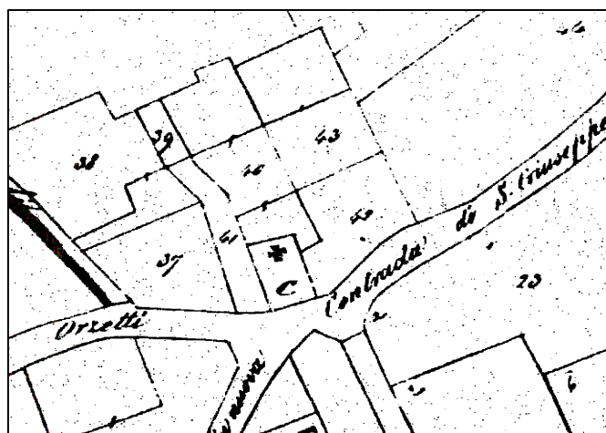
catasto 1853 - scala 1:1.000

Edificio di notevole interesse storico architettonico