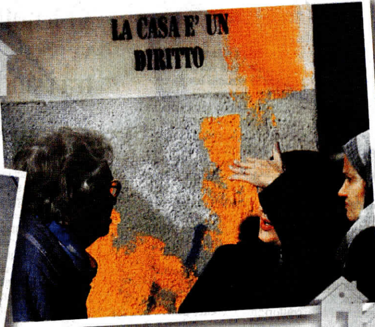
Le case occupate in via Monte Grigna a Bergamo